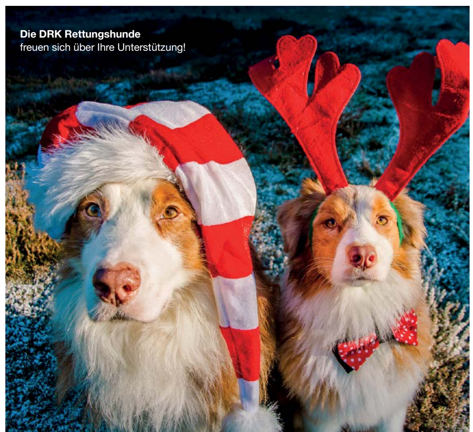
Die DRK Rettungshunde freuen sich über Ihre Unterstützung!