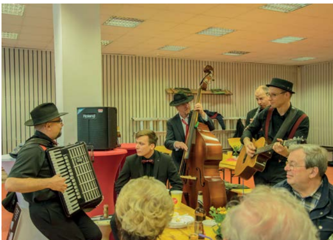
Bei Musik und Tanz können sich die Haupt- und Ehrenamtlichen auch kulinarisch verwöhnen lassen.

Das nächste DRK Grillfest für alle haupt- und ehrenamtlich Mitarbeitenden des Kreisverbands und seiner gGmbHs findet am 10. Mai 2019 ab 17 Uhr in der Geschäftsstelle statt.