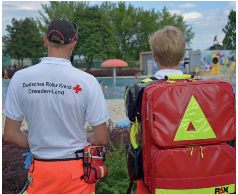
Der Sanitätsdienst im Einsatz

Fit gemacht für den Einsatz werden die Ehrenamtlichen direkt am Standort Radebeul im Rahmen von verschiedenen Ausbildungsmodulen.