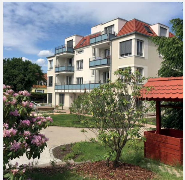
Die DRK Seniorenwohnanlage in Langebrück.

Aktuelle Stellenanzeigen finden Sie immer unter: www.drk-dresden.de