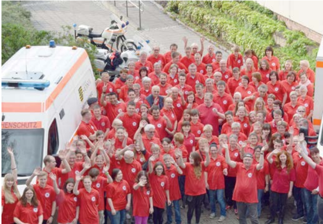
Das DRK Grillfest ist jedes Jahr ein Highlight

Alljährlich veranstalten Vorstand und Geschäftsführung anlässlich des Welt-Rotkreuz-Tages ein DRK Grillfest für alle haupt- und ehrenamtlichen Mitarbeiter*innen.