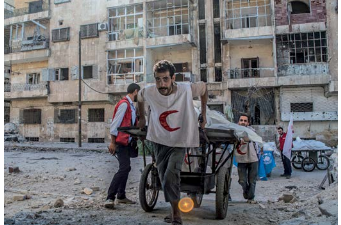
Das Schutzzeichen gut sichtbar: Helfer des Syrischen Roten Halbmonds im Syrienkonflikt

Die größte Herausforderung besteht nicht etwa in fehlenden Regeln, sondern im unzureichenden Respekt für bestehende Normen. Gezielte Angriffe auf Zivilpersonen, humanitäre Helfer