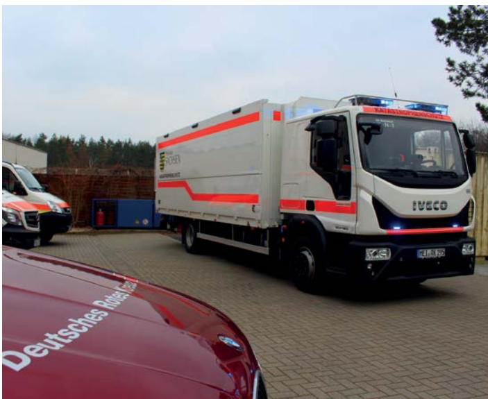
Der neue Gerätewagen Versorgung des Freistaat Sachsen steht ab sofort in Radebeul einsatzbereit für Notfälle zur Verfügung

Mit dem neuen Gerätewagen Versorgung kann der Einsatzzug Radebeul künftig noch mehr Notleidende oder Einsatzkräfte versorgen.